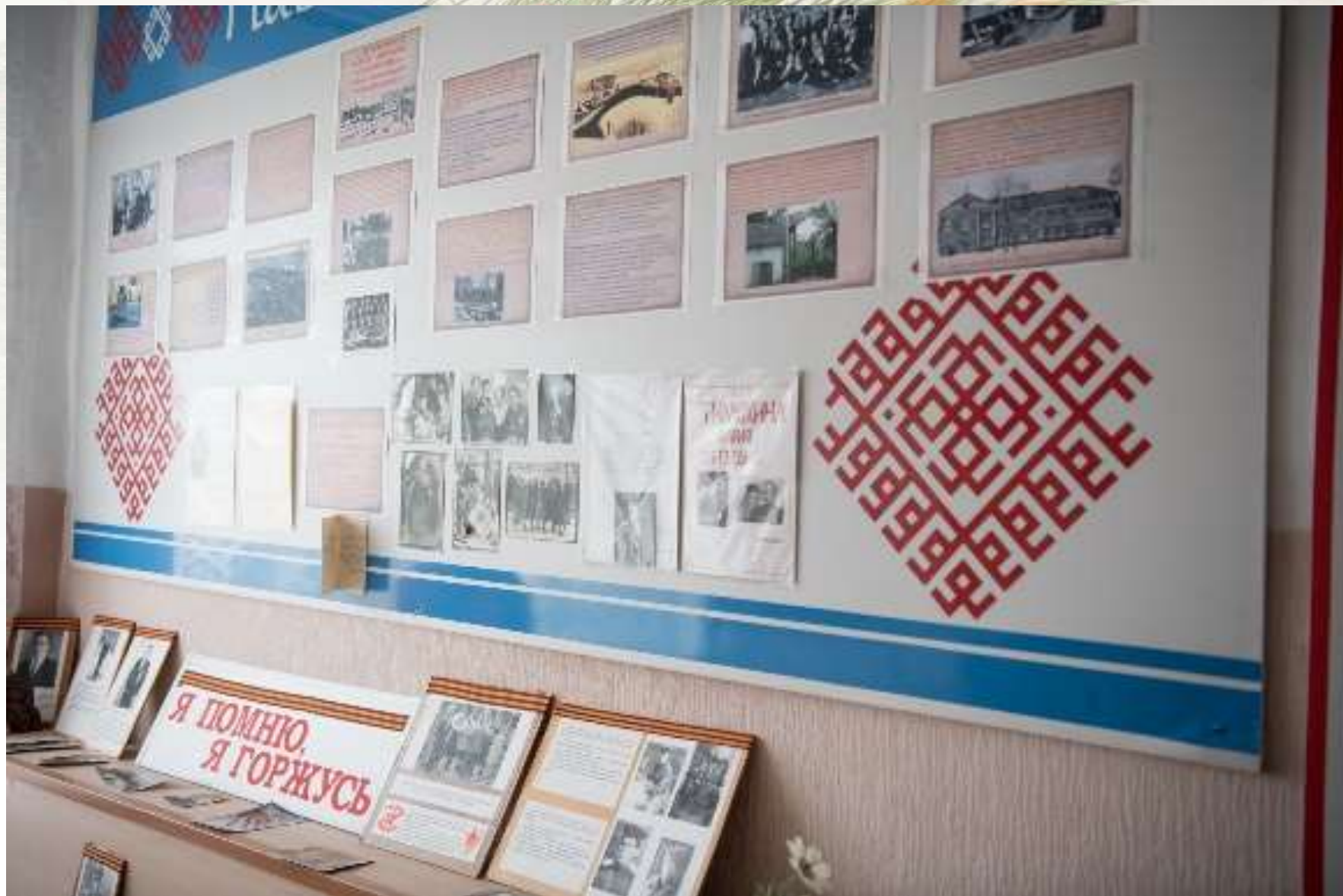
Материалы исследовательских работ студентов колледжа, посвященных уроженцам Zubovo-Polyansky District, участникам Великой Отечественной войны